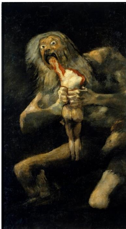
Francisco Goya: Saturn požírající svého syna

Dítě rozbije vázu. Taťka ho potrestá, mamka utěší. Dítě se časem naučí vázy nerozbíjet, později možná vynalezne vázu nerozbitnou. Soutěž a solidarita utvářejí rodinu i dějiny. Svět dětský, ženský a mužský se doplňují a prolínají.